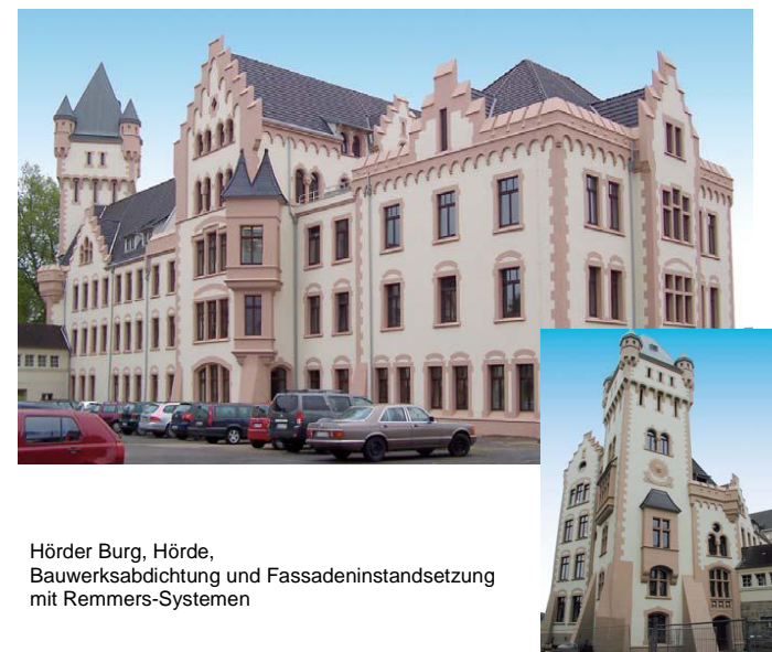
Hörder Burg, Hörde, Bauwerksabdichtung und Fassadeninstandsetzung mit Remmers-Systemen